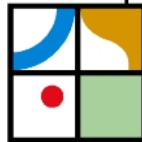
Tavola B 4